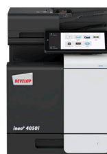
ineo i-Serie + 4050i

Wir setzen uns auch dafür ein, den Abfall während des gesamten Produktlebenszyklus zu minimieren. Während unsere verbesserten Verbrauchsmaterialien und Teile weniger Material verbrauchen und eine längere Lebensdauer bieten, sorgt unsere branchenführende Lösung für die Luftpolsterverpackung für einen sicheren Transport und reduziert gleichzeitig den Abfall um 20 %.