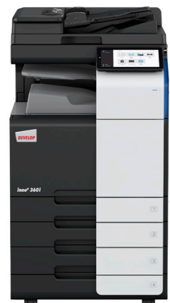
ineo i-Serie + 360i