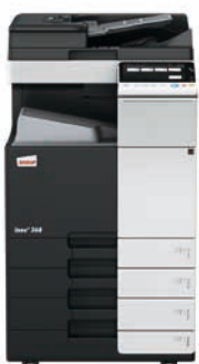
ineo+ 368 mit Dual Scan Original-einzug (DF-704), Ausgabefach (OT-506) und Papiereinzug (PC-210)

Wenn Sie in eine ineo+ 368 investieren, sind Sie in Bezug auf Spezialaufgaben, wie z. B. auf hochwertigem Karton gedruckte Einladungen, nicht mehr von externen Dienstleistern abhängig. Dadurch sparen Sie Zeit und Geld. Mit der ineo+ 368 können Umschläge, Recyclingpapier, vorbedrucktes Papier, OHP-Folien, viele andere Medien und selbst Karton bis zu einem Papiergewicht von 300 g/m 2 bearbeitet werden. Diese Systeme können zahlreiche Papierformate, von A6 bis A3+ (SRA3), sowie benutzerdefinierte Formate und Banner bis zu einer Länge von 1,2 Metern bedrucken. Außerdem ermöglichen die vielfältigen Endbearbeitungsoptionen das Erstellen bis zu 80-seitiger Broschüren, verschiedene Arten des Brieffaltens, das Heften von Handouts oder Lochen von Rechnungen. Mit einer ineo+ 368 kann fast jeder Druckauftrag intern bearbeitet werden.