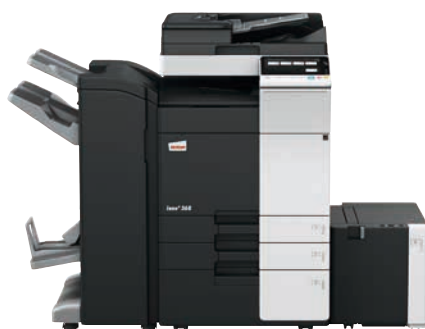
ineo+ 368 mit Dual Scan Original-einzug (DF-704), Heftfinisher mit Broschüreeneinheit (FS-534SD), Großraumfach (LU-302) und Papiereinzug (PC-410)