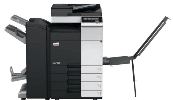
ineo+ 368 mit Dual Scan Original-einzug (DF-704), Heftfinisher mit Broschüreeneinheit (FS-534SD), Bannereinzug (BT-C1e) und Papiereinzug (PC-210)