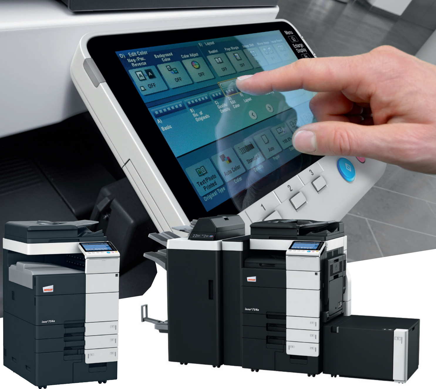
ineo+ 754e mit zusätzlicher Ausgabe Ablage (OT-503)