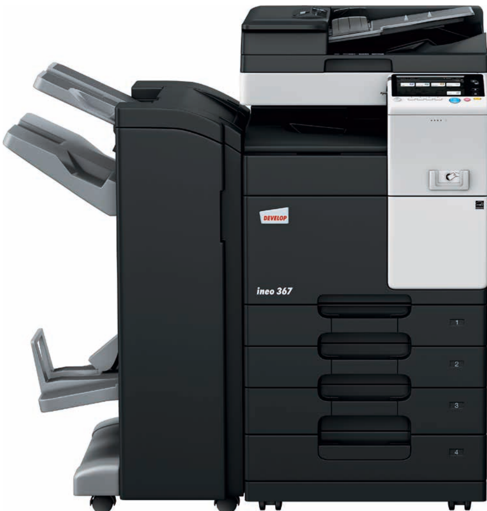
ineo 367 mit Duplex-Originalerzug (DF-628), Heft-/Broschüren-Finisher (FS-534SD), Papiereinzug (PC-213) und Montage-Kit für lokales ID-Kartenauthentifizierungsgerät (MK-735)

Jobcenter, Schulen und Universitäten, Ingenieur- und Architekturbüros, Versicherungen, Banken, Bibliotheken: Viele kleine und mittlere Unternehmen oder Organisationen brauchen oft keinen Farbdruck. Was die Nutzer dort wirklich brauchen, ist ein Schwarzweiß-Multifunktionsgerät, das intuitiv bedienbar ist und einfache mobile Nutzung für die steigende Zahl der mobilen Büroangestellten bietet.