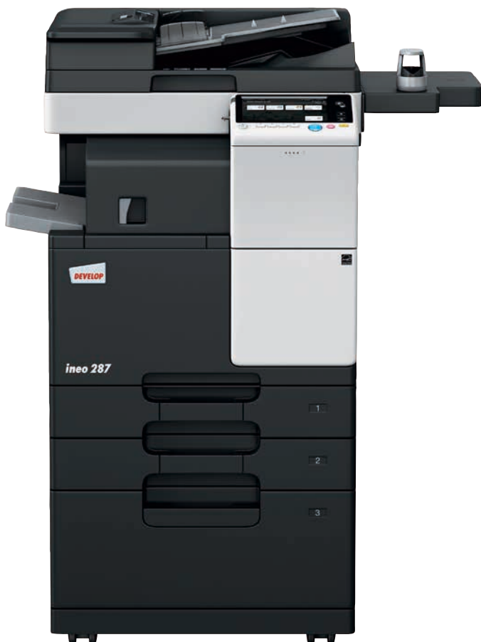
ineo 287 mit Duplex-Origineleinzug (DF-628), integriertem Finisher (FS-533), Papiereinzug (PC-413) und biometrischer Authentifizierungseinheit (AU-102)

Jobcenter, Schulen und Universitäten, Ingenieur- und Architekturbüros, Versicherungen, Banken, Bibliotheken: Viele kleine und mittlere Unternehmen oder Organisationen brauchen oft keinen Farbdruck. Was die Nutzer dort wirklich brauchen, ist ein Schwarzweiß-Multifunktionsgerät, das intuitiv bedienbar ist und einfache mobile Nutzung für die steigende Zahl der mobilen Büroangestellten bietet.