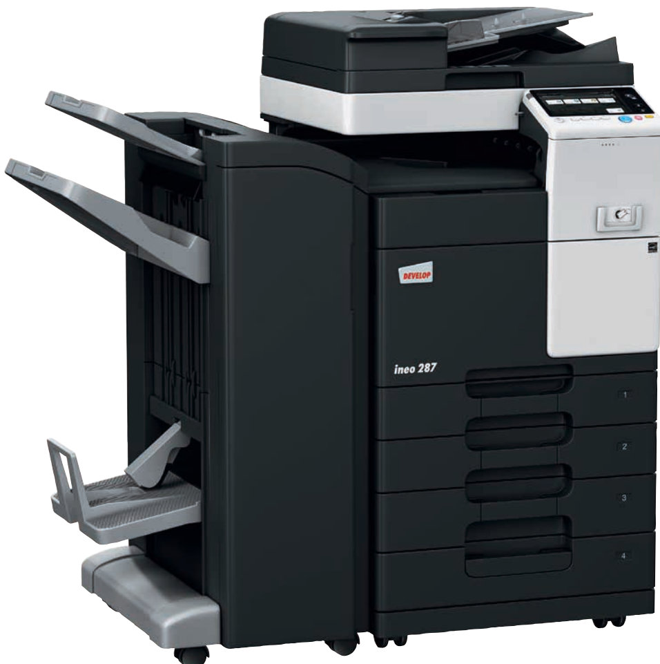
ineo 287 mit Duplex-Origineleinzug (DF-628), Heft-/Broschüren-Finisher (FS-534SD), Papiereinzug (PC-213) und Montage-Kit für lokales ID-Kartenauthentifizierungsgerät (MK-735)

Die Schwarzweißsysteme zeichnen sich durch eine Vielzahl von Energiesparfunktionen aus, die den Energieverbrauch senken. Diese Funktionen sparen nicht nur Geld, sondern sind auch gut für die Umwelt – und Ihre CO 2 -Bilanz.