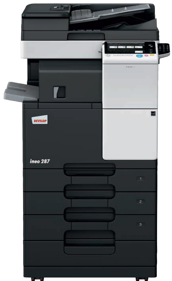
ineo 287 mit Duplex-Origineleinzug (DF-628), Zweifachablage (FS-533), Papiereinzug (PC-113) und 10er-Tastatur (KP-101)