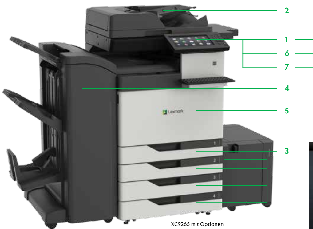
XC9265 mit Optionen

Drucken Sie Microsoft Office-Dateien, PDFs und andere Dokument- und Bildarten von Flash-Laufwerken, oder wählen Sie Dokumente auf Netzwerk-Servern oder Online-Laufwerken aus und drucken Sie sie.